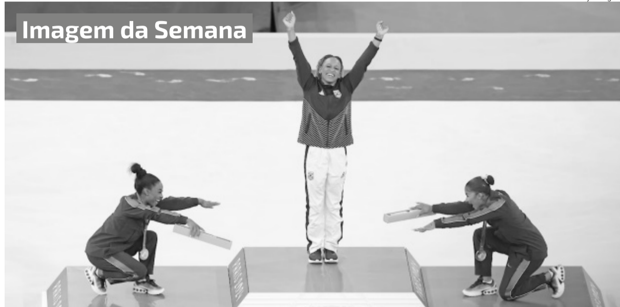
Imagem da Semana

O ministro Flávio Dino, do STF, decidiu manter a suspensão das "emendas Pix" ao Orçamento da União. Estão liberadas apenas as emendas para obras em andamento e situações de calamidade pública. Dino também suspendeu todas as emendas impositivas, que incluem emendas individuais e de bancada criadas pela Emenda Constitucional 105 de 2019.